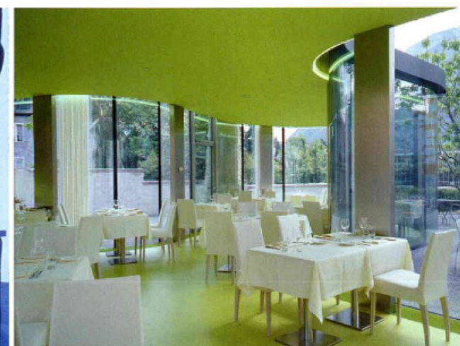
L'intérieur avec le plafond et le sol verts s'intègre harmonieusement dans le jardin.

Les arbres sont présents même dans les chambres d'hôtes.